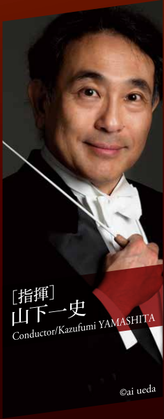
[指揮] 山下一史 Conductor/Kazufumi YAMASHITA