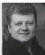
ラデク・バボラーク (ホルン) Radek Baborák, Horn

チェコ・フィル、ミュンヘン・フィル、バンベルク響、ベルリン・フィルの首席を歴任し、現在、西ボヘミア交響楽団首席指揮者、チェコ・シンフォニエッタ芸術監督。