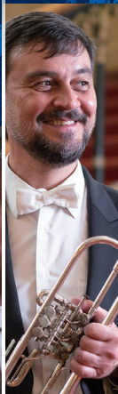
ライナー・キューブルベック (トランペット)