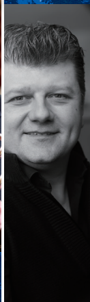
ラデク・バボラーク (ホルン)