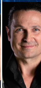
ワルター・フオーグルマイヤー (トロンボーン)